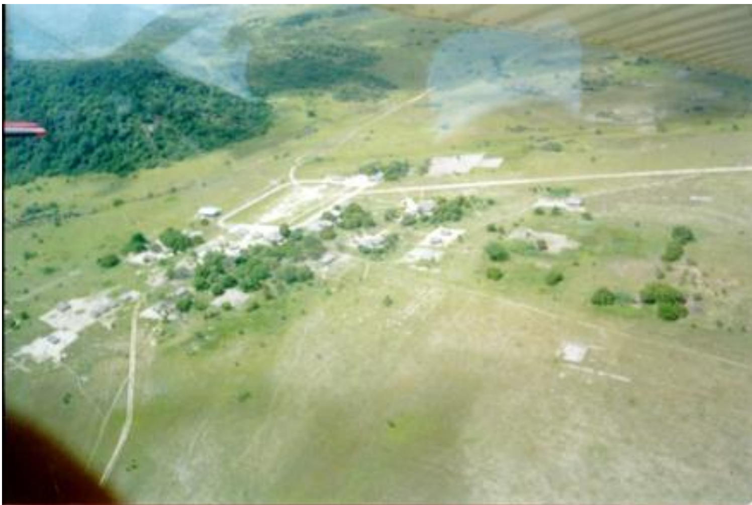
Aldeia Maruwai, RO (vista aérea)